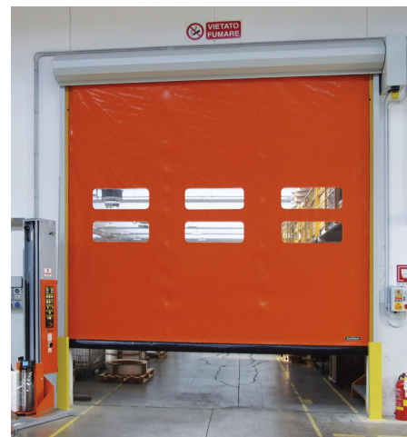
Portone rapido Eolo Auto.