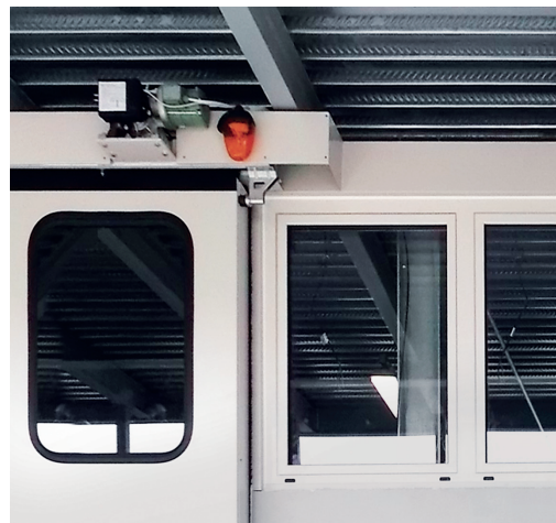
Motorizzazione meccanica a catena, completa di motore/i trifase 380V, montata su guida portante superiore verniciata.

Tutti gli automatismi sono marchiati CE con l'apertura ad "uomo presente".