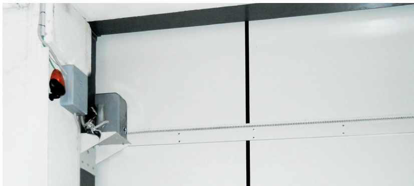
Motorizzazione meccanica a cremagliera completa di motore trifase a 380V applicato in parete.

Il materiale deve sempre essere installato da personale specializzato e secondo le normative vigenti.