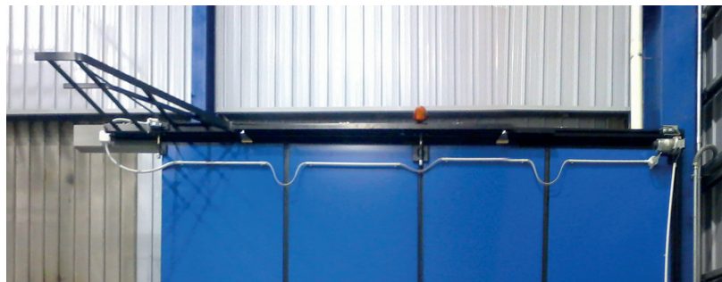
Vista interna portone a libro Anteo con motorizzazione meccanica a cremagliera completa di motore 24 V, installato su anta.

Il materiale deve sempre essere installato da personale specializzato e secondo le normative vigenti.