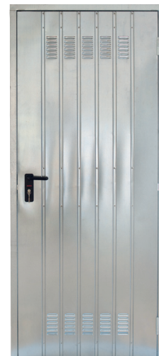
Vista esterna porta Pratik zincata.

Tinte Ral selezionate verniciatura per esterni porta Pratik (optional).